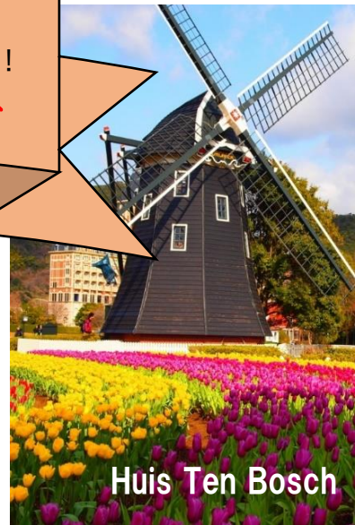
Huis Ten Bosch