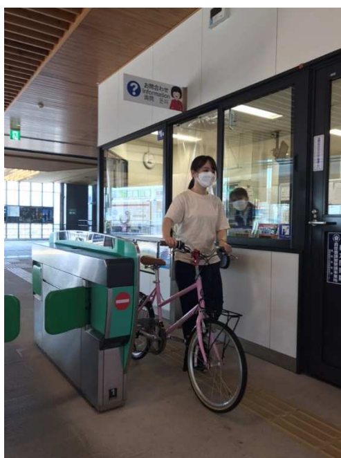
エレベーターや階段を利用して改札口まで移動